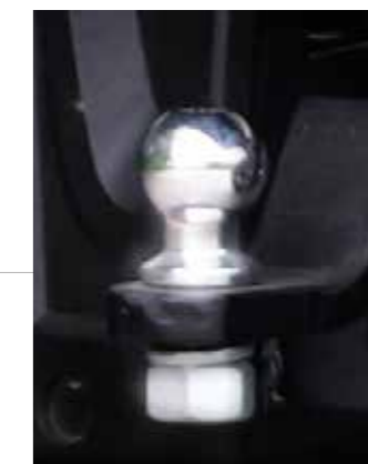
ANHÄNGVORRICHTUNG mit Anhängelast 2,7 t