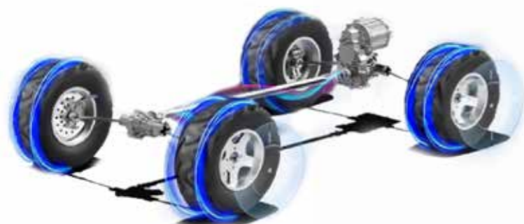
ANTRIEB 2WD (Hinterradantrieb) oder 4WD, Straßenmodus bis 50 km/h, Geländemodus bis 30 km/h, Differenzialsperre vorne