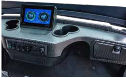
7-Zoll LCD Farbdisplay