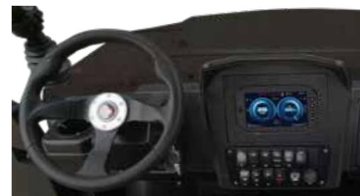
ARMATUREN EPS (elektrische Servolenkung) Multiinformationsdisplay 7 Zoll 12 V Anschluss Doppel-USB-Anschluss Rückfahrkamera