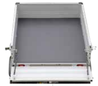
Ladefläche mit elektrischer Kippfunktion