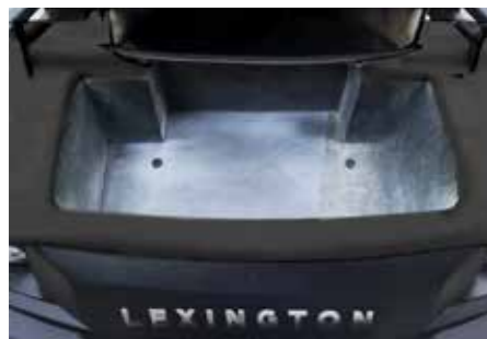
STAURAU 34 Liter