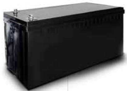
MARXON BATTERIE Marxon Lithium-Ionen-Akku 76,8 V, 200 Ah, 15,36 kWh