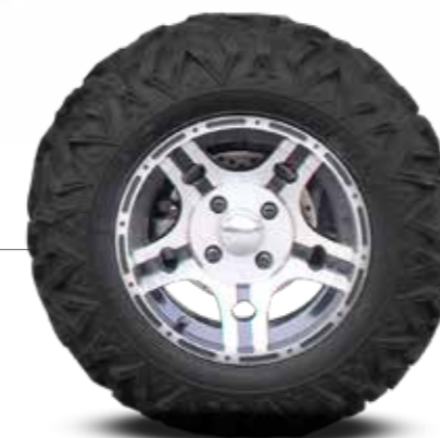
RÄDER Großer Durchmesser mit 26 Zoll auf 14 Zoll Aluminiumfelge 300 mm Bodenfreiheit