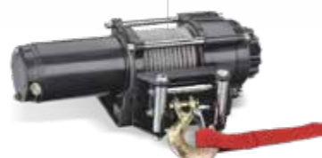
ELEKTRISCHE WINDE mit 1,5 t Zugstärke