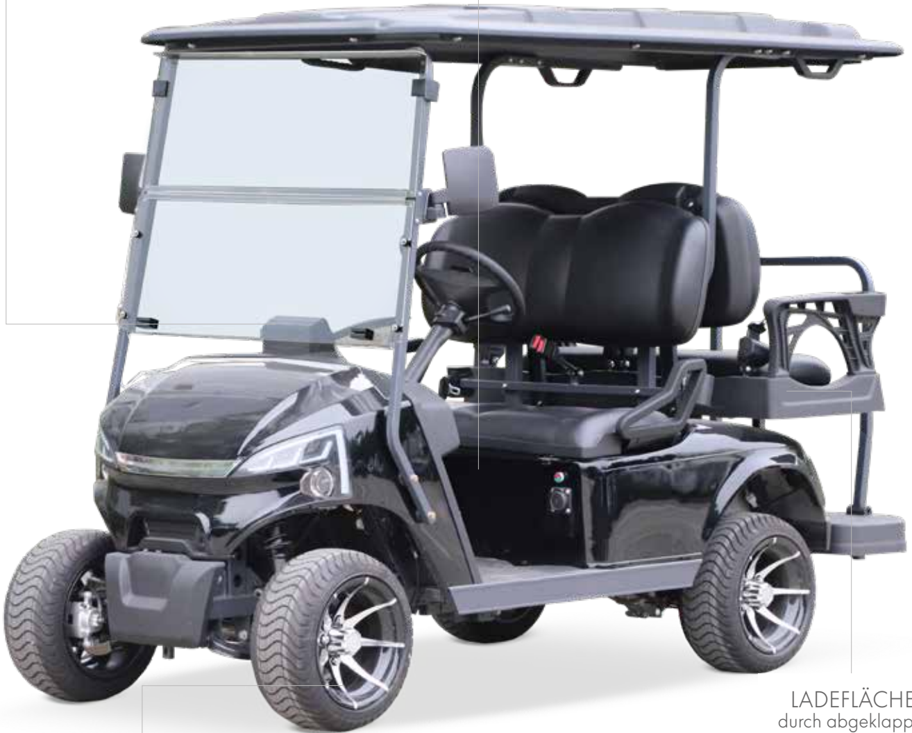
ALUFELGEN mit Straßenbereifung 215/35-12