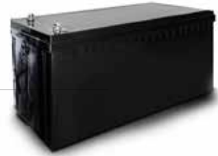
MARXON BATTERIE Lithium-Ionen 51,2 V, 105 Ah, 5,38 kWh