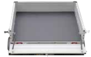
Ladefläche mit manueller Kippfunktion