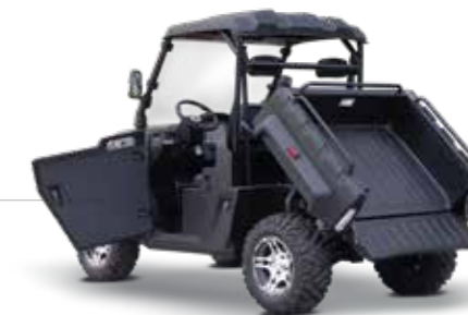
LADEFLÄCHE mit elektrischer Kippfunktion