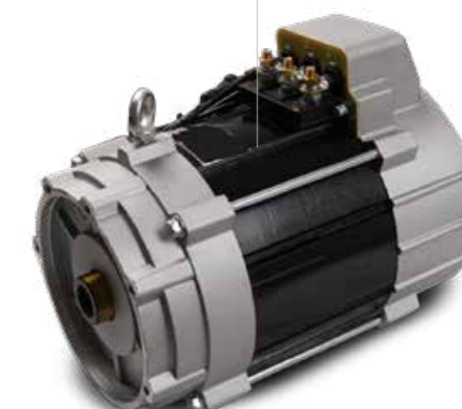
MOTOR Leistung 15 KW (20,4 PS) / 30 KW (40,8 PS) peak Drehmoment 47 Nm / 150 Nm peak Rekuperationsfunktion