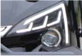
LED SCHEINWERFER mit Lupenprojektion für höhere Leuchtdichte