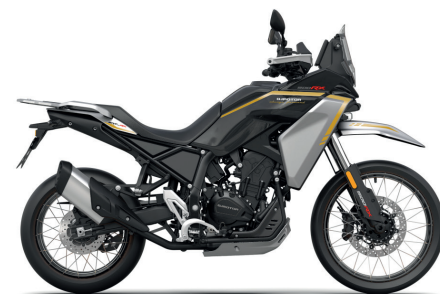
Schwarz / Silber