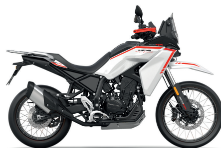
Weiß / Schwarz