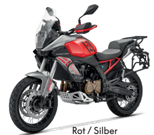
Rot / Silber