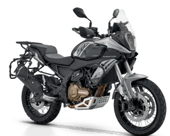
Schwarz / Silber