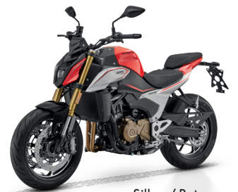
Silber / Rot