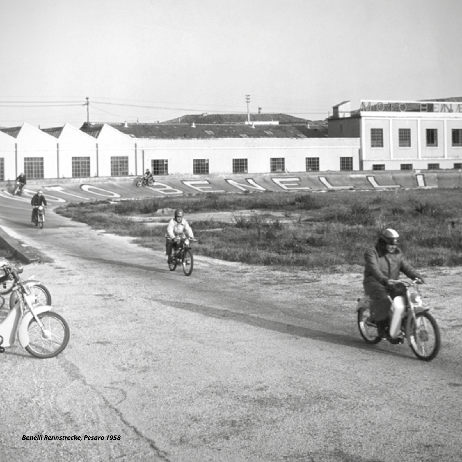
Benelli Rennstrecke, Pesaro 1958