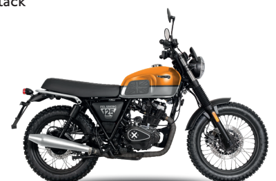
California Orange/Timberwolf Grey