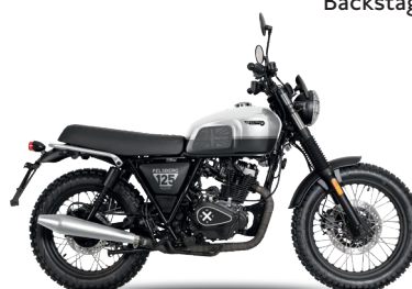
Arctic White/Backstage Black