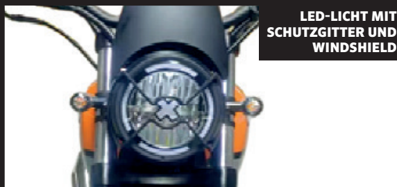
LED-LICHT MIT SCHUTZGITTER UND WINDSHIELD