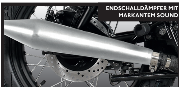
ENDSCHALLDÄMPFER MIT MARKANTEM SOUND

Vielseitigkeit: Stadtköner & Landstraßenheld – für jeden Tag gebaut.