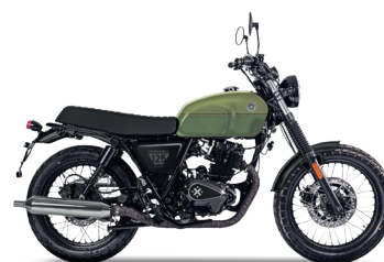
Army Green/Olive Green