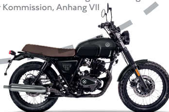
Backstage Black/Titan Black