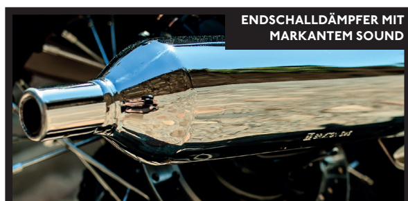
ENDSCHALLDÄMPFER MIT MARKANTEM SOUND

Motorleistung: Spritziger 125ccm-Viertakter – ideal für Stadt und Landstraße.