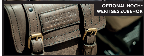
OPTIONAL HOCHWERTIGES ZUBEHÖR