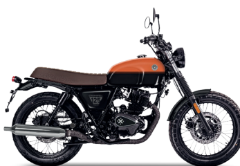
California Orange/Titan Black