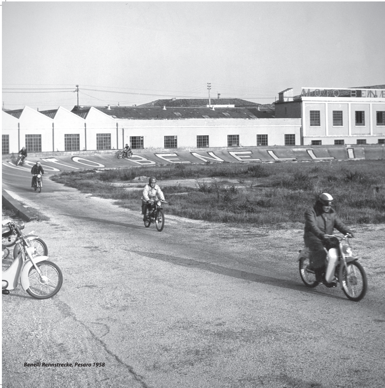
Benelli Rennstrecke, Pesaro 1958