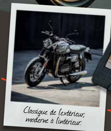
Classique de l'extérieur, moderne à l'intérieur.