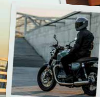
Throwback to the future

Cette brochure vous fournit des informations complètes sur la nouvelle Cromwell. Alors, si vous êtes à la recherche de quelque chose de différent, jetez-y un œil et découvrez en quoi elle pourrait être faite pour vous. Le style de la moto vous plaît? Alors n'hésitez plus une seconde et réservez un essai gratuit auprès d'un de nos revendeurs : enfourchez la Cromwell 1200 et démarrez !