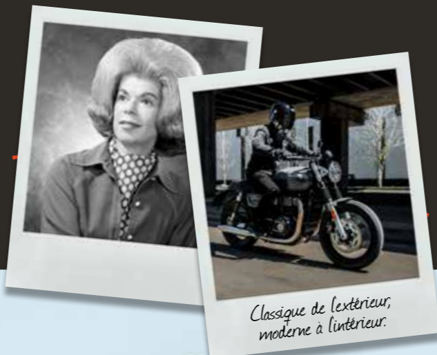
Classique de l'extérieur, moderne à l'intérieur.