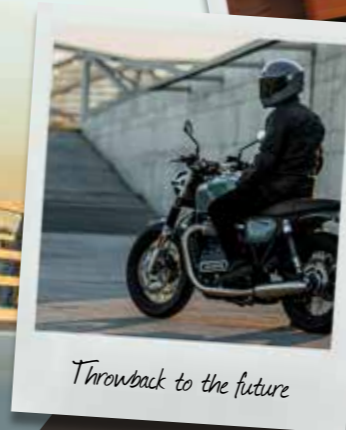
Throwback to the future