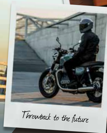
Throwback to the future