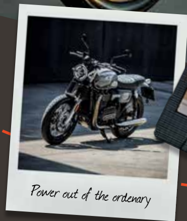
Power out of the ordinary

Wenn du also nach etwas Besonderem suchst, solltest du jetzt genauer hinschauen und herausfinden, warum die Cromwell das ist, wonach du suchst. Wenn dir gefällt, was du siehst, gibt es einen klaren Weg für dich: Probefahrt buchen, aufsitzen, Gas geben.