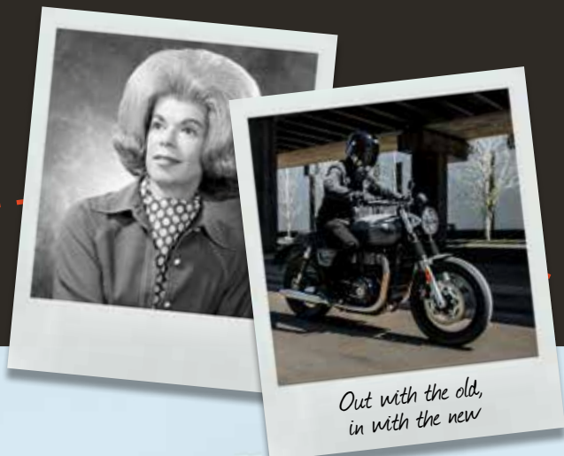
Out with the old, in with the new