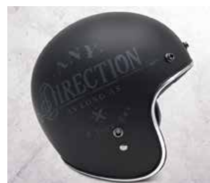
CASCO - OPEN FACE BLACK MATT