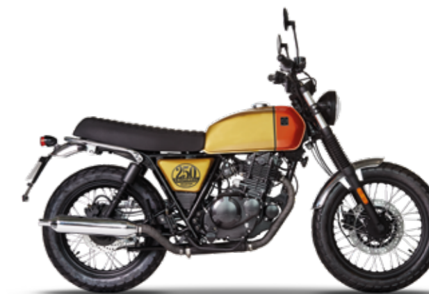
DESERT GOLD / CLOCKWORK ORANGE