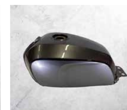
SERBATOIO GREEN, RED, GREY, BLUE, BLACK, SILVER