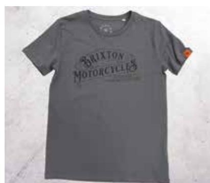
T-SHIRT WESTERN ANTHRAZIT

Segui il tuo stile e porta in strada la tua moto Brixton come più ti piace. Scegli tra una varietà di accessori, tra cui marmitte, serbatoi, selle colorate e manubri per personalizzare al massimo la tua moto, che diventa unica come te. Per un elenco dettagliato delle proposte visita il sito brixton-motorcycles.com/parts