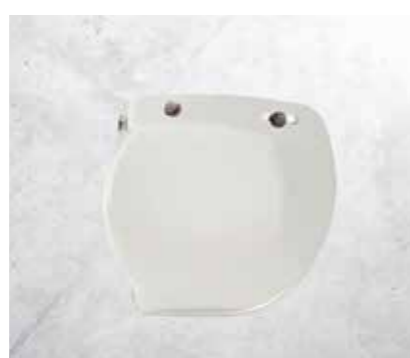
VISIERA A BOLLA NON PIEGHEVOLE