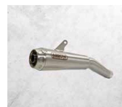
IMPIANTO DI SCARICO ARROW ACCIAIO INOX