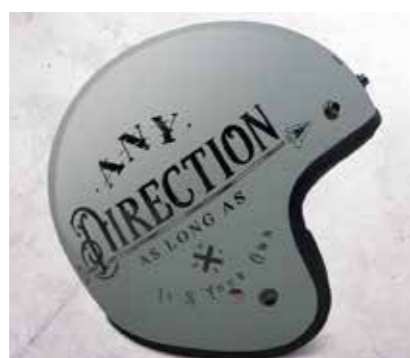
CASCO - OPEN FACE GREY