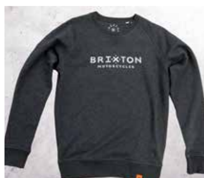
FELPA DARK GREY