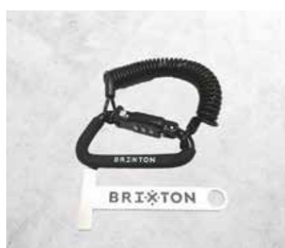
LUCCHETTO PER IL CASCO