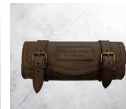
BORSA DEGLI ATTREZZI