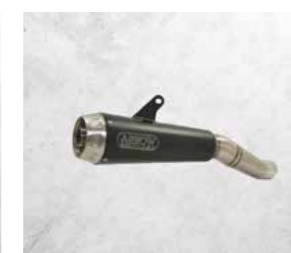
IMPIANTO DI SCARICO ARROW ACCIAIO INOX