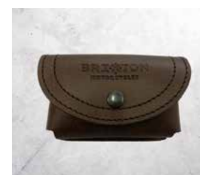
BORSA PORTA LUCCHETTO