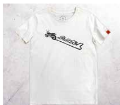
T-SHIRT TRACK WHITE