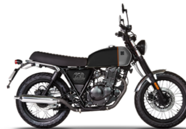
TITAN BLACK / STERLING GREY

* rispetta il Regolamento Delegato (UE) N. 134/2014 della Commissione, allegato VII