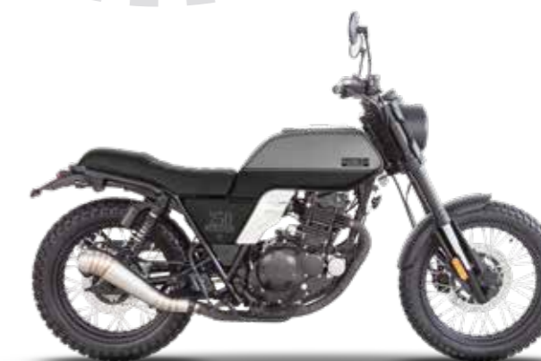
BACKSTAGE BLACK / TIMBERWOLF GREY