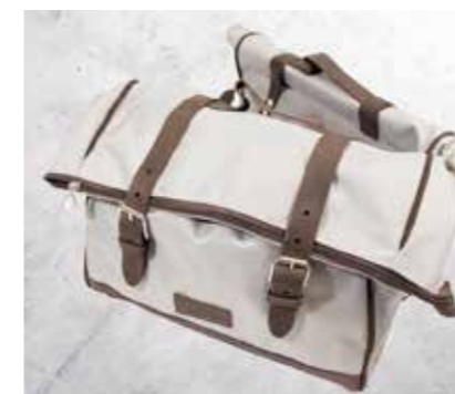
BORSE LATERALI INCL. SUPPORTO