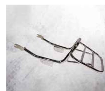
PORTAPACCHI BLACK, CHROM