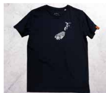
T-SHIRT LIGHT BLACK