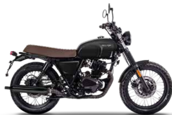
BACKSTAGE BLACK / TITAN BLACK